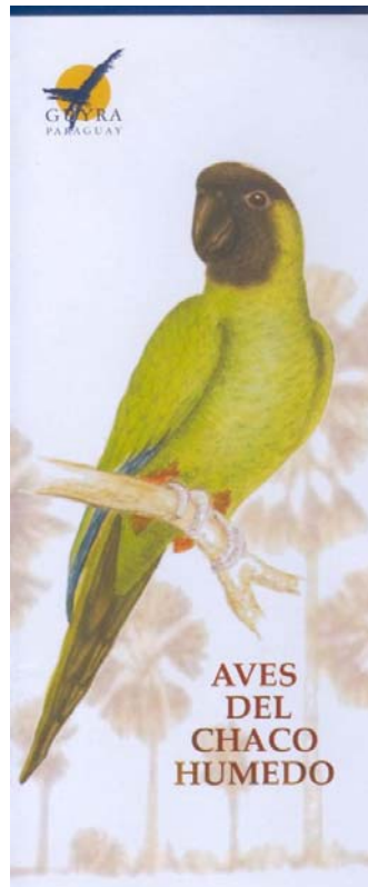
La guía desplegable de Aves del Chaco húmedo, uno de los materiales de difusión distribuidos a los participantes del evento.