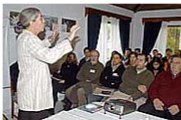
Sandra Knapp, experta del Museo de Historia Natural de Londres, diserta sobre el papel de la ciencia en la conservación, ante profesionales paraguayos en el Hotel Portal del Sol.

Con el propósito de destacar la riqueza de la biodiversidad del Bajo Chaco, exponiendo al mismo tiempo las presiones y amenazas que afectan esta ecorregión, se realiza hasta hoy un seminario sobre "Iniciativas para la implementación del convenio de diversidad biológica en Paraguay y Argentina", en el salón de eventos del Hotel Portal del Sol, avenida Denis Roa 1455 casi Santa Teresa, de 8:00 a 13:00.